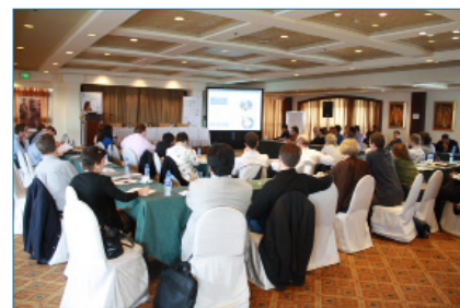
Asamblea General Microinsurance Network 2010

La próxima reunión del Comité Ejecutivo se llevará a cabo en enero de 2011.