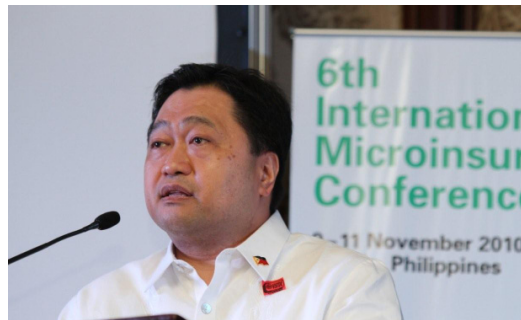
Cesar V. Purisima, Ministro de Finanzas de Filipinas