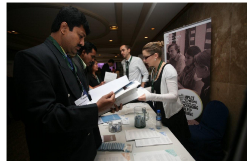
El stand del Microinsurance Network